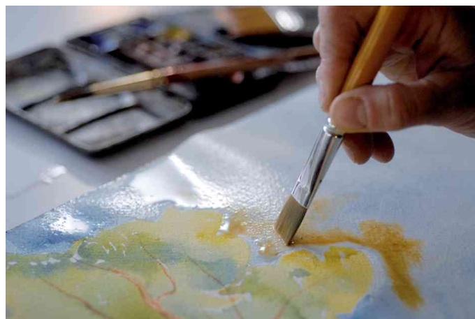
Visuel de référence: bloc papier à dessin "Montval"