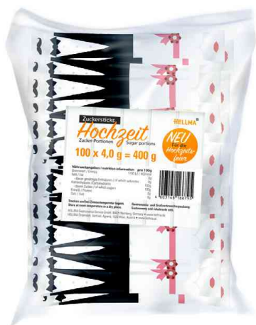
Sticks de sucre "mariage", sachet en plastique