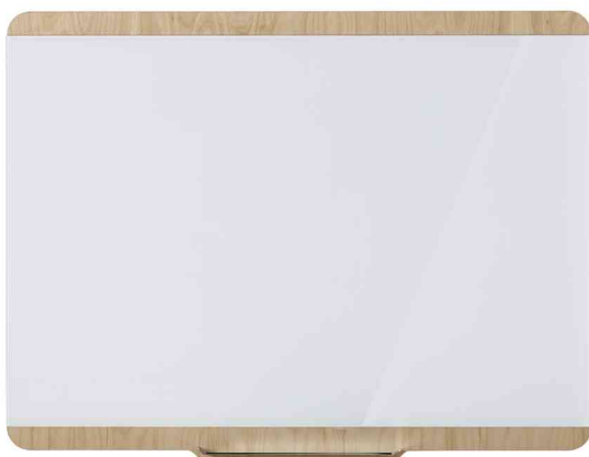
Tableau magnétique en verre "Douro"