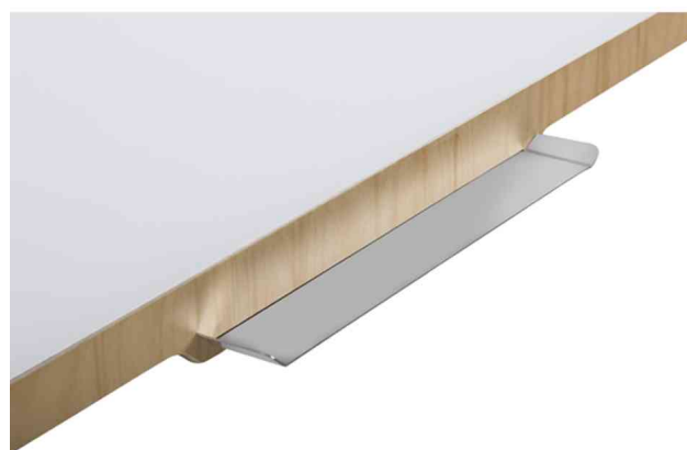
Vue détaillée : auget porte-marqueurs en acier inoxydable