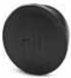
Kunststoffschutzkappe, antistatisch, für Steckverbinder mit M23-Rändelmutter

Kunststoff-Staubschutzkappe antistatisch - RC-Z2468 - 1611796