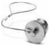
Metallschutzkappe mit Stahlseil und Schlaufe, für M23-Signalsteckverbinder mit Rändelmutter zur Befestigung am Kabel