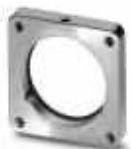
Vierkant-Montageflansch, Axialdichtung, 4xM3, Flanschmaß: 35 mm x 35 mm

Vierkant-Montageflansch - RF-Z0003 - 1607905