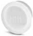
Kunststoffschutzkappe für Steckverbinder mit M23-Rändelmutter

Kunststoff-Staubschutzkappe antistatisch - RC-Z2468 - 1611796