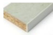
table de travail