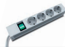
Steckdosenleiste 4-fach standard