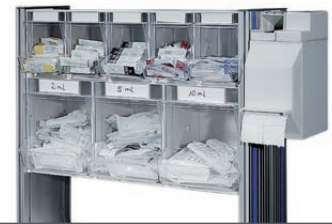
Injektionsset PicBox® + KOMBI-Set