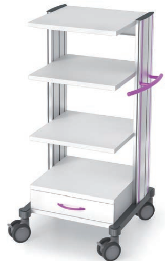
swingo®-clinic 45 in Metall Gerätewagen