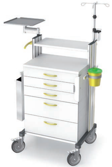
swingo®-clinic 60 in Metall Notfallwagen