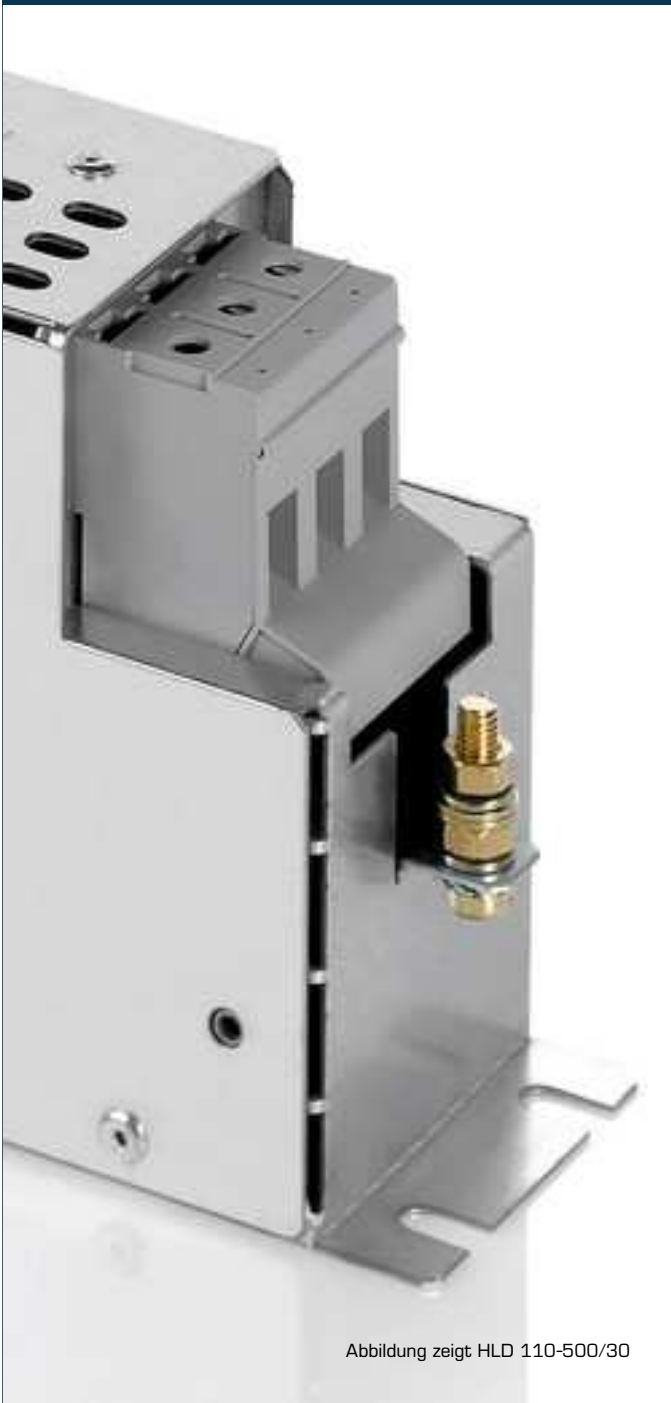
Abbildung zeigt HLD 110-500/30