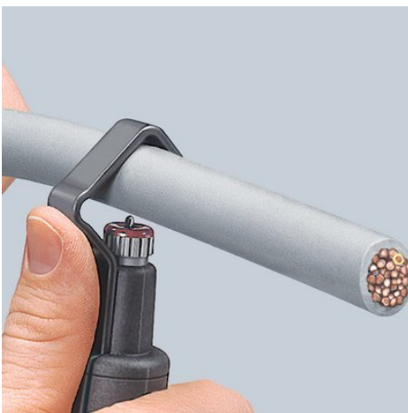
Przystawianie narzędzia do cięcia po obwodzie

Dopuszcza się zmiany i błędy w podanych parametrach technicznych