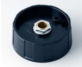
A2540060 RUNDKNOPF 40, ohne Strich ABS (UL 94 HB) schwarz RAL 9005 40x15mm 6mm