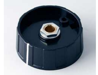
A2640060 RUNDKNOPF 40, mit Strich ABS (UL 94 HB) schwarz RAL 9005 40x15mm 6mm