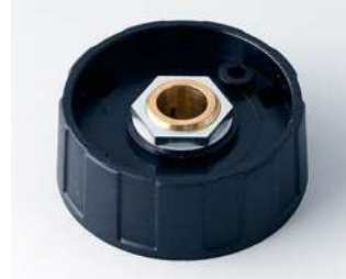
A2540080 RUNDKNOPF 40, ohne Strich ABS (UL 94 HB) schwarz RAL 9005 40x15mm 8mm