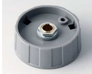
A2540068 RUNDKNOPF 40, ohne Strich ABS (UL 94 HB) staubgrau RAL 7037 40x15mm 6mm