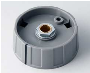
A2640068 RUNDKNOPF 40, mit Strich ABS (UL 94 HB) staubgrau RAL 7037 40x15mm 6mm

Technische Änderungen vorbehalten. © OKW Gehäusesysteme, Buchen/Deutschland.