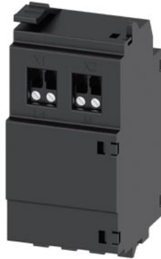
24 Volt Modul Zubehör für: 3VA2 400/630/1000