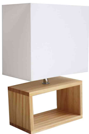
Lampe de bureau LED DEKO