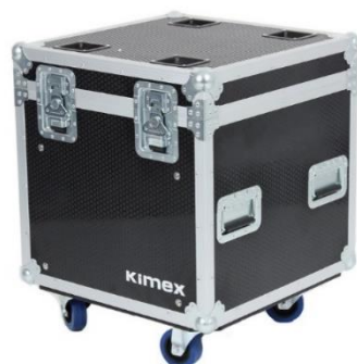
100-0406 Flight case de type malle avec rangement (60 x 60 x 60 cm)