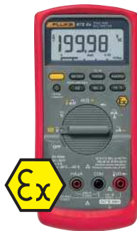
Fluke 87V Ex