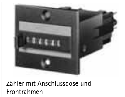
Zähler mit Anschlussdose und Frontrahmen