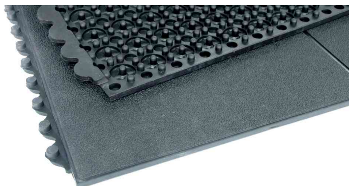
Tapis de travail Yoga Solid Basic