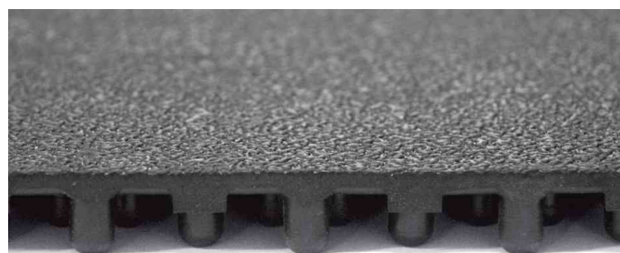
Vue de profil