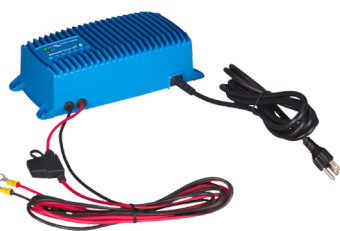
Chargeur Blue Smart IP67 12/25