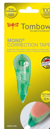
Rouleau correcteur "MONO CT-CCE4", vert