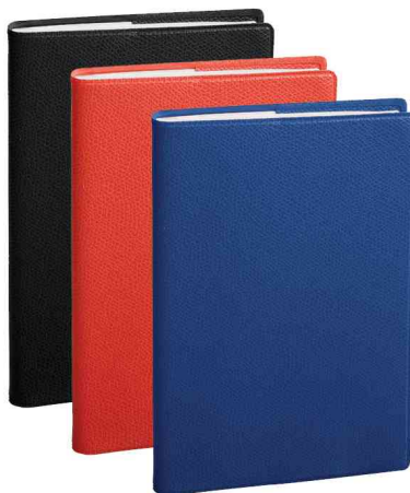
Agenda "Planning SD", assorti