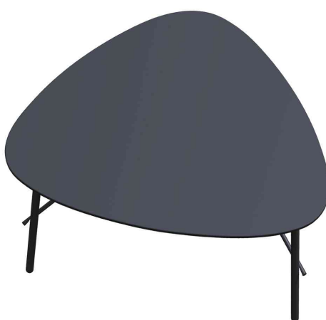
Table d'appoint LAZY, (L)605 x (H)500 mm, noir