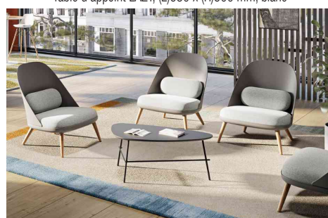
Visuel de référence : présente le produit en utilisation