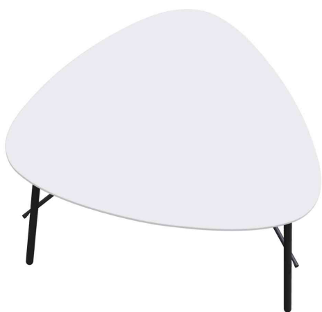
Table d'appoint LAZY, (L)605 x (H)500 mm, blanc