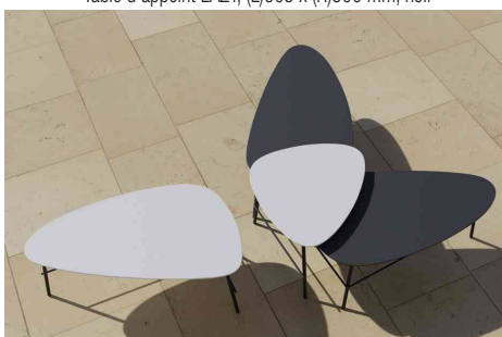
Visuel de référence : présente le produit en utilisation