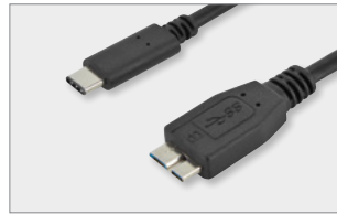
Typ-C™ - micro B, M/M