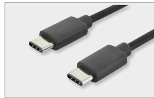
Typ-C™ - C, M/M