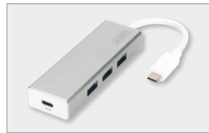
USB 3.0 3-Port Hub mit Typ-C™ Power Delivery Funktion