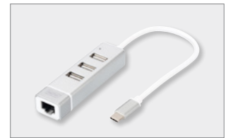
USB 2.0 3-Port Hub & Fast Ethernet LAN Adaptor with Typ-C™ Connector