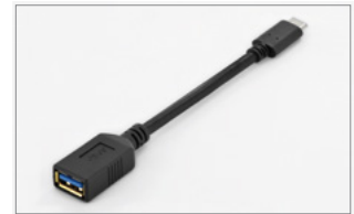
Typ-C™ - A, M/F