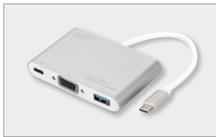
USB 3.0 Typ-C™ VGA Multiport