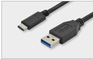
Typ-C™ - A, M/M