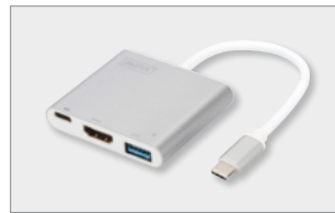
USB 3.0 Typ-C™ HDMI Multiport