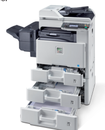
Abbildung mit Optionen.