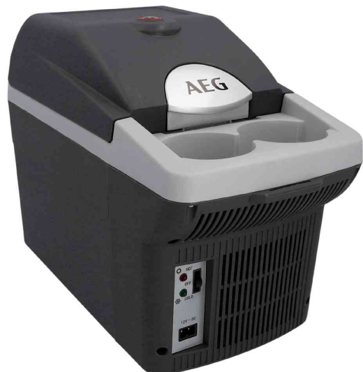
Glacière Bordbar BK 6