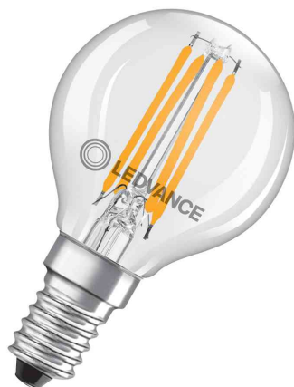
Visuel de référence: Ampoule LED CLASSIC P, culot E14