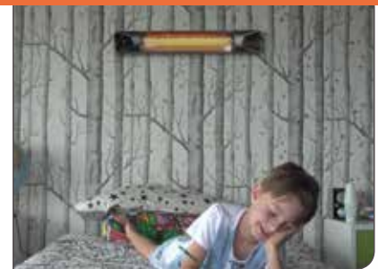
Sicher im Gebrauch dank Abschalt- Automatik & UV-freier Strahlung