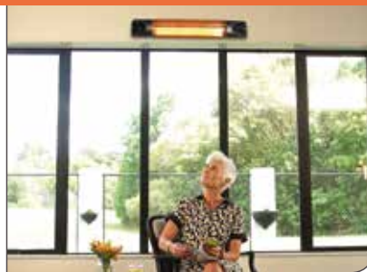
Ideal für Wohnzimmer, Badezimmer, Terrasse, Wintergarten, Garage, Keller uvm.