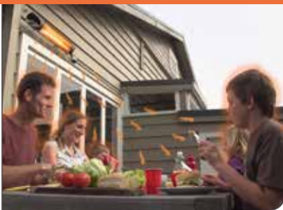
Einfachste Montage an Decke, Wand, Mauervorsprung usw.