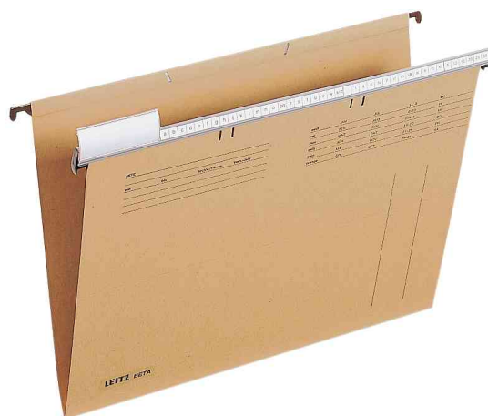
Dossiers suspendus BETA