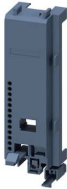
Schützsockel Baugröße S00/S0