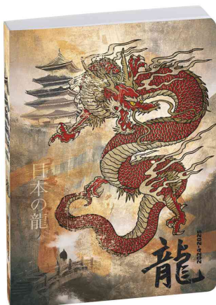
Agenda scolaire FORUM "Samouraï" Dragon