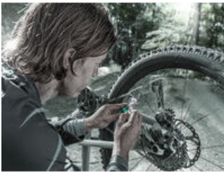
Das Bicycle Set 3 A

Mit den glasfaserverstärkten Reifenhebern aus Kunststoff lassen sich die Reifen sicher von der Felge hebeln, ohne die Felge zu beschädigen. Ein Reifenheber mit Ventilausdreher, ein Reifenheber mit 1/4" Bit-Aufnahme.