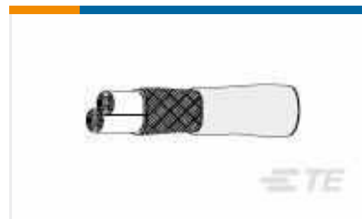
TE Teilenummer3822873005 44A1121-20-2/6-9