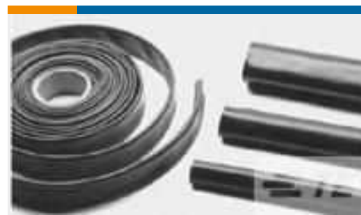
TE TeilenummerCB5026-000 BSTS-11X4