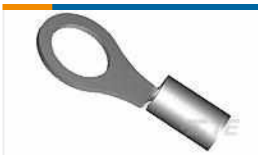
TE Teilenummer323059 TERMINAL,SOLIS R HT 12-10 6