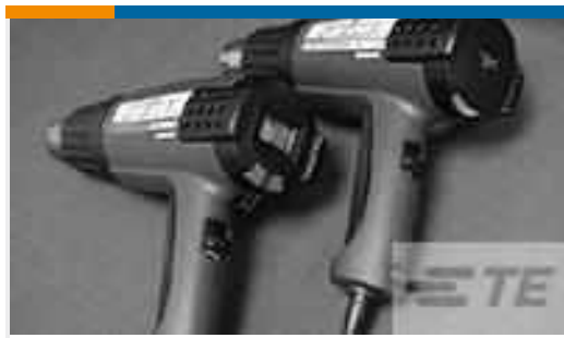
TE Teilenummer CJ2087-000 HL2010E-KIT-120V