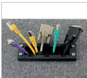
... così come in ambito energetico e tecnologia costruttiva