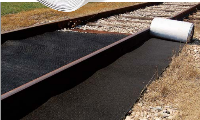
Anwendung auf Bahngleisen: Die breite Rolle passt präzise zwischen die Schienen. Mit der schmalen Rolle werden die Seitenbereiche geschützt.