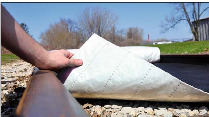
Flüssigkeitsdichte Unterseite bietet extra Sicherheit: ideal, wenn der Untergrund vor durchsickernden Flüssigkeiten geschützt werden soll.