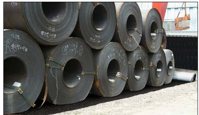
Anwendung als Unterlage zum Schutz des Bodens: Die Outdoor Rollen nehmen Öl, aber kein Wasser auf.