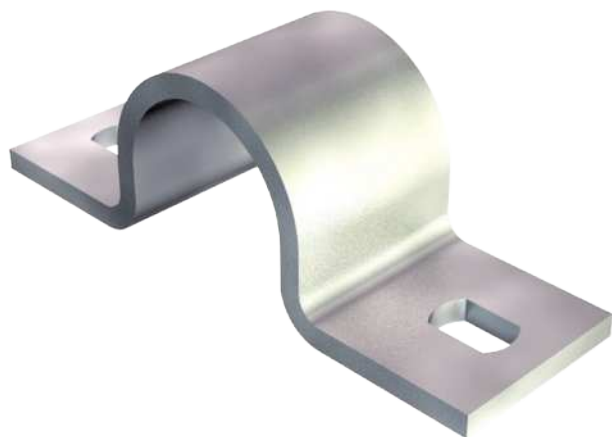
Befestigungsschelle zweilappig 28mm