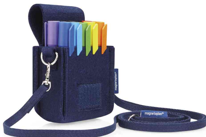
Sac à marqueurs "Marker Holster ecoAware", ouvert