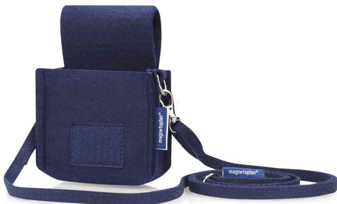
Sac à marqueurs "Marker Holster ecoAware"