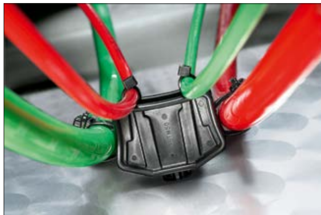
Mit dem 3-Wege-Halter können 3 große oder 4 kleine Bündel gleichzeitig geführt werden.