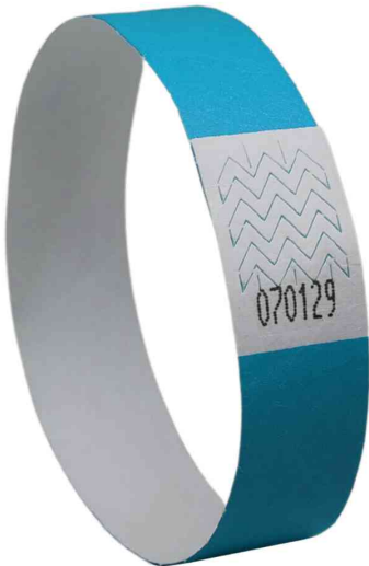
Bracelet imprimable, bleu fluo