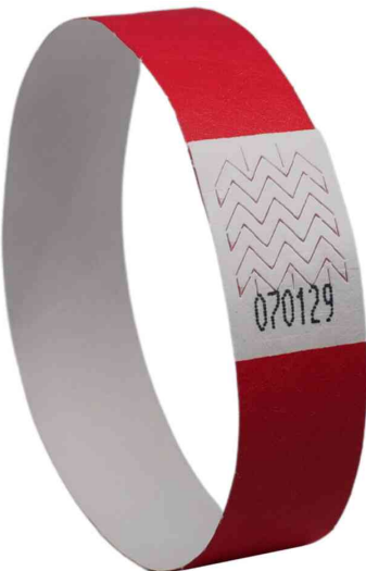
Bracelet imprimable, rouge fluo