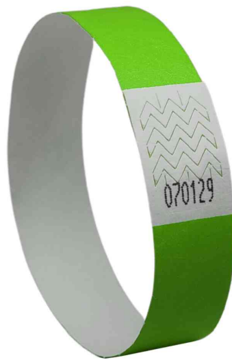
Bracelet imprimable, vert fluo