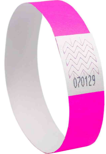
Bracelet imprimable, rose fluo