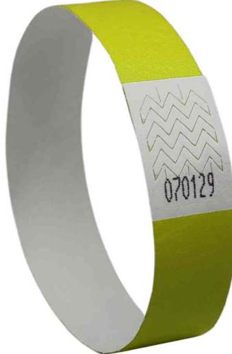
Bracelet imprimable, jaune fluo