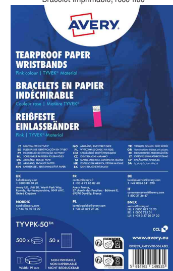
Visuel de référence : emballage