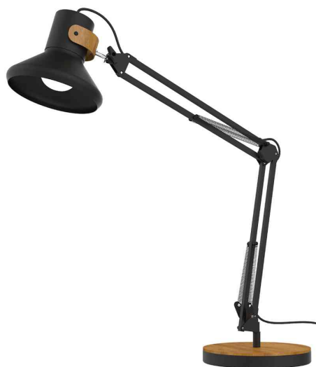
Lampe de bureau à LED BAYA BAMBOO, noir