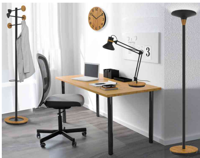
Visuel de référence : présente la gamme Bamboo