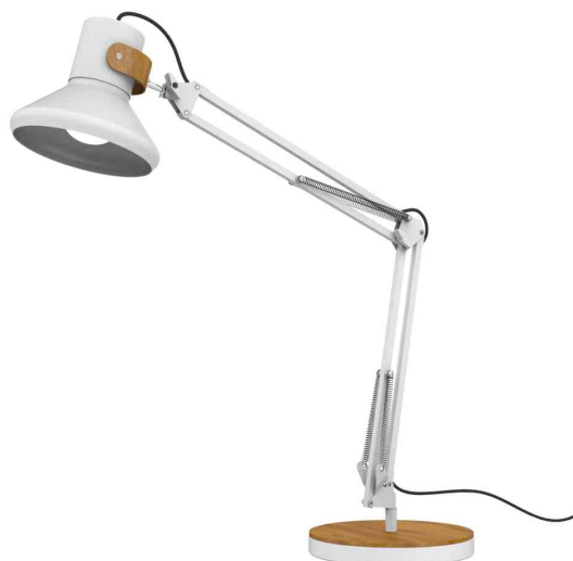
Lampe de bureau à LED BAYA BAMBOO, blanc