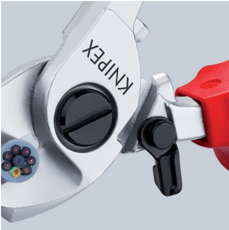
95 26 165: Vergrendelklink vergrendelt lemmetten met binnen liggende openingsveer

Een kabel snijden met een kabelschaar: makkelijke en zuivere snede zonder vervorming van de kabel