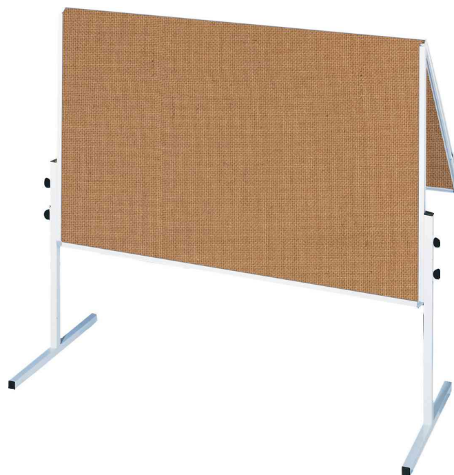
Tableau de présentation U-Act! Line, rabattable, jute