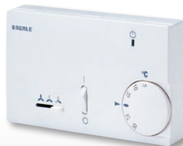
KLR-E 525 52 hp