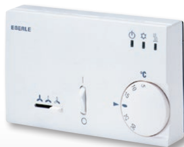
KLR-E 525 52 4p