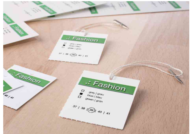
Warenanhänger SPECIAL, Anwendung