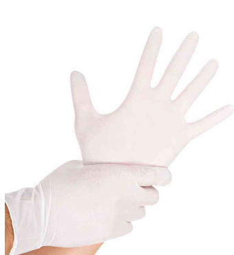
Visuel de référence: présente le produit