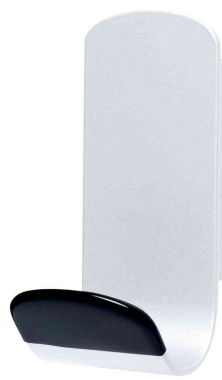
Patère "STEELY", magnétique, blanc / noir