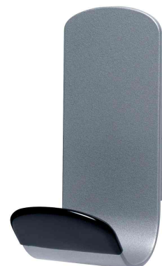
Patère "STEELY", magnétique, gris / noir