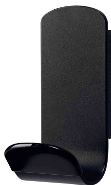
Patère "STEELY", magnétique