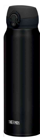
Bouteille isotherme Ultralight, noir