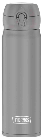
Bouteille isotherme Ultralight, gris