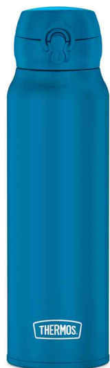
Bouteille isotherme Ultralight, bleu