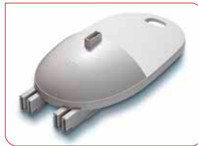
Integrierter Griff und sichere Arretierung aller Einzelteile für leichtes Tragen.