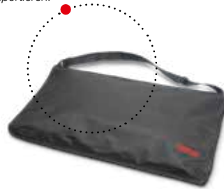
Transporttasche seca 412 für bequemes Transportieren.