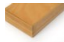
table de travail