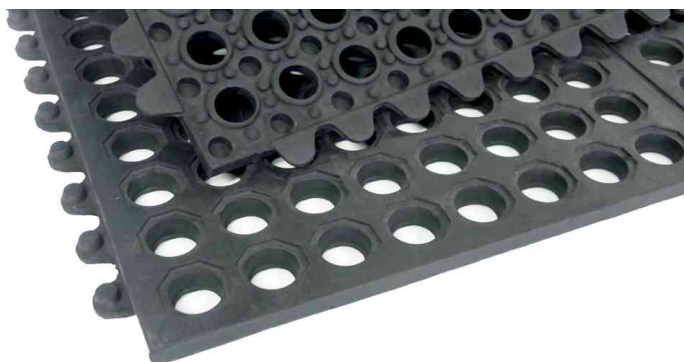
Tapis de confort en anneaux Yoga Octa Basic