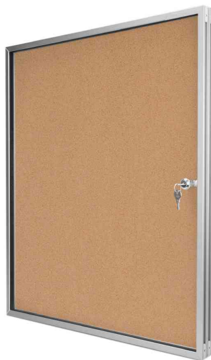
Visuel de référence: Vitrine d'affichage SP liège - fermé