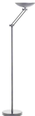
Lampadaire à LED DELY 2.0 ARTICULATED, gris métallisé