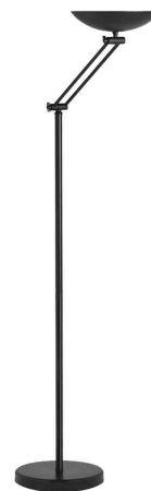
Lampadaire à LED DELY 2.0 ARTICULATED, noir