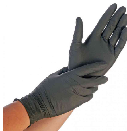
Visuel de référence : gant nitrile Safe Fit, noir