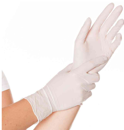
Visuel de référence : gant nitrile Safe Fit, blanc