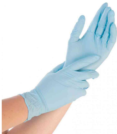
Visuel de référence : gant nitrile Safe Fit, bleu