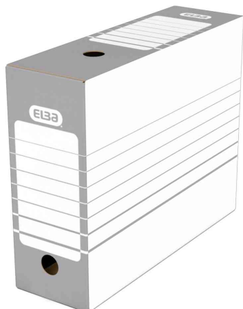
Boîte d'archives (L)100 mm