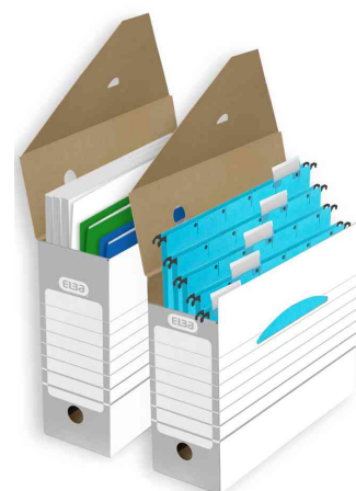
Visuel de référence: livré sans contenu